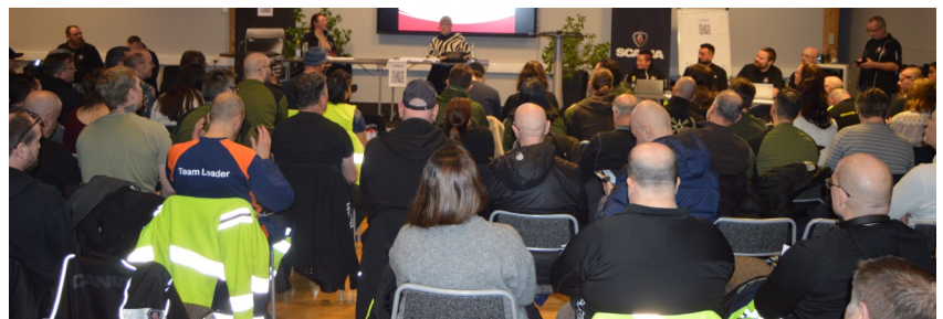
Imponerande 107 deltagare på årsmötet!